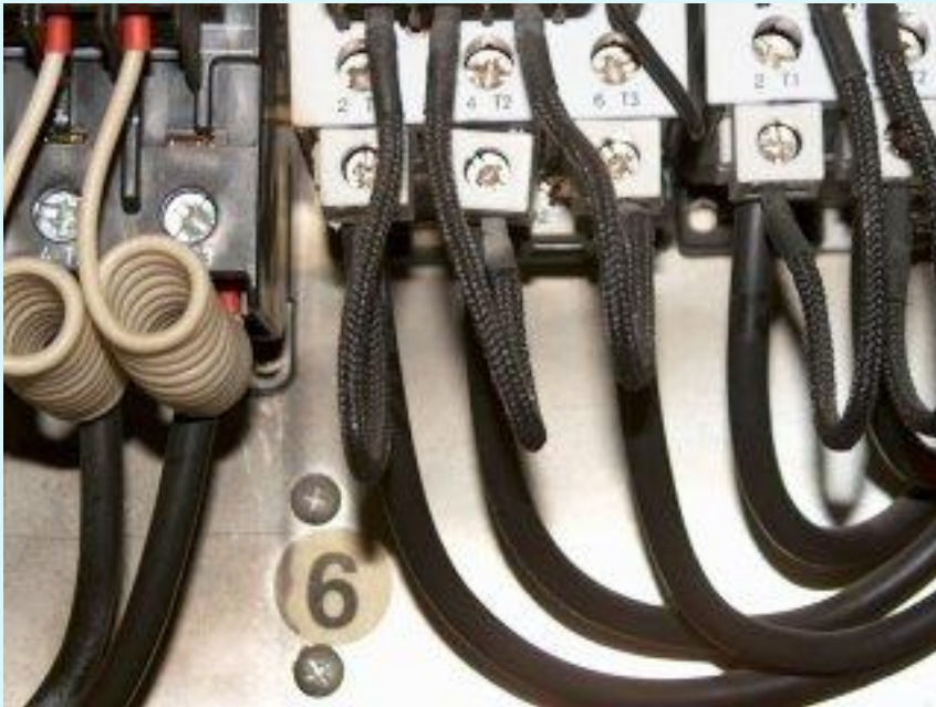
Tavle set med øjet